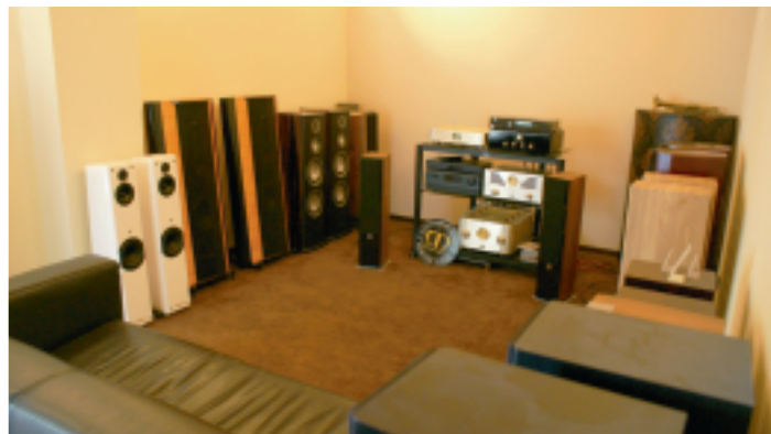
ZAPRASZAMY DO NASZEJ SALI ODŚLUCHOWEJ

Do zbudowania podstawowego systemu stereo, który umożliwi nam odtwarzanie płyt CD niezbędne są nam tak naprawdę trzy elementy: wzmacniacz, odtwarzacz CD oraz para kolumn.